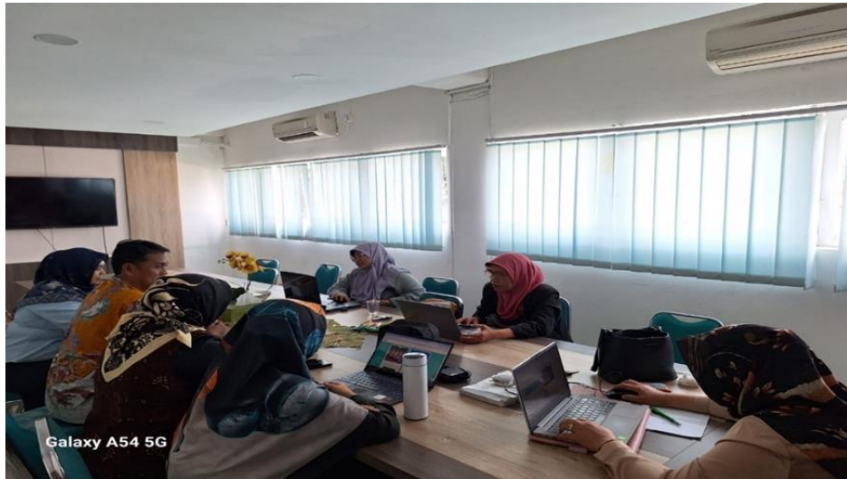
Galaxy A54 5G