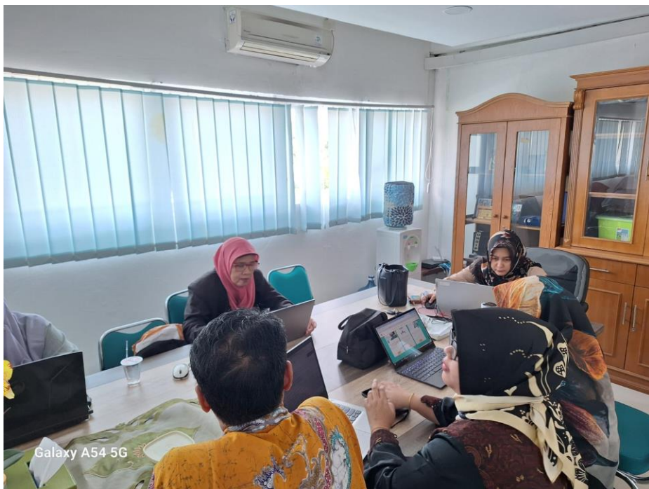
Galaxy A54 5G