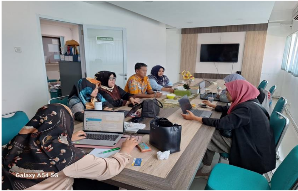
Galaxy A54 5G